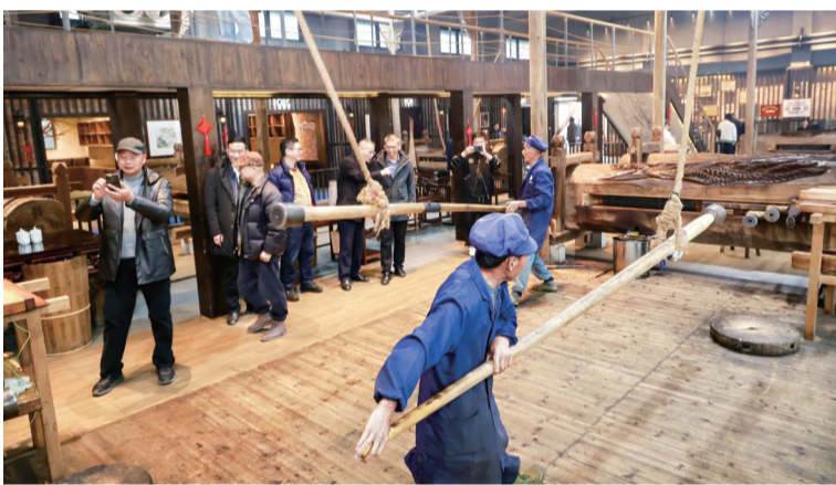
山茶油传统制作工艺——“木龙榨”。