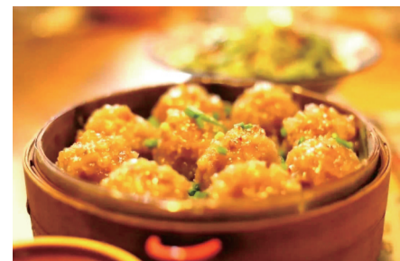
衢州小吃。资料图片