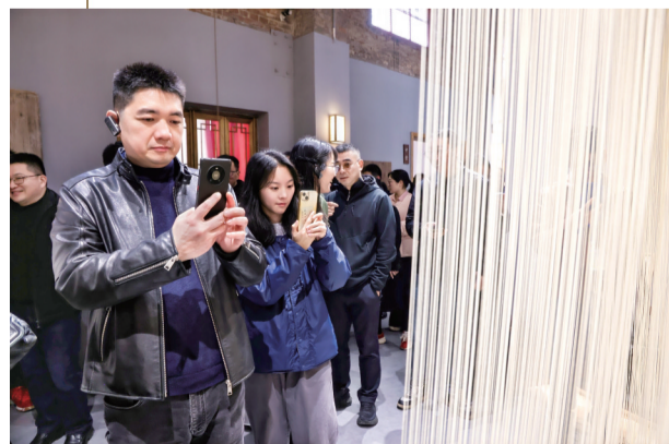
参观常山贡面非遗文化体验馆。