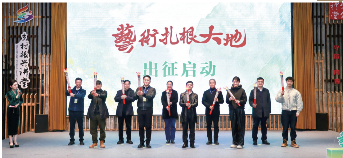
“艺术扎根大地”计划启动。

刚刚过去的一周,对衢州文艺界来说,是极其难忘的一周。浙江省“艺术扎根大地”计划在衢州启动,来自全省各地的百余名文联系统代表和艺术家代表走进衢州,领略艺术扎根三衢大地的生动场景。