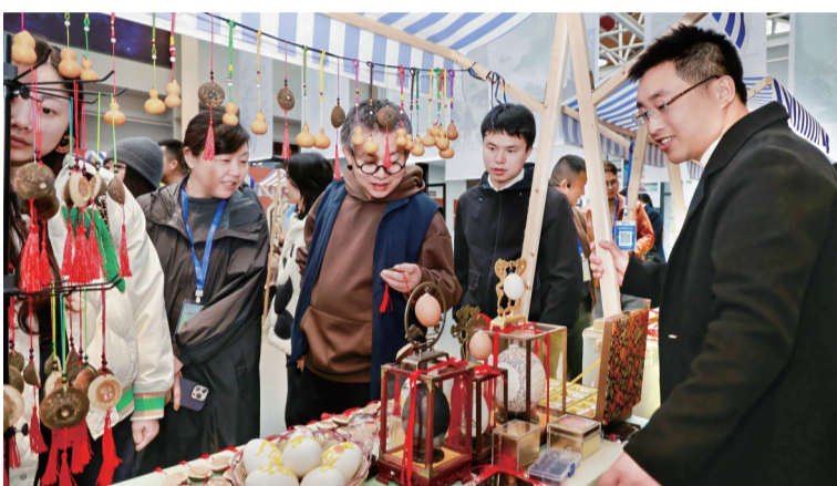
非遗市集上展示了不少非遗文创成果。