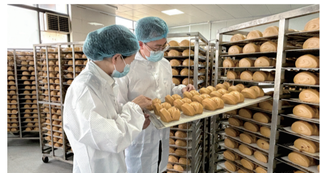
衢州海关关员在企业仓库对即将出口的红糖馒头进行查验。

本报讯(记者 王继红 通讯员 谢俊 文/摄)6月20日,由中冷(浙江)食品科技有限公司生产的一批红糖馒头经衢州海关检验检疫合格后,顺利装箱出口美国,这也是衢州辖区首次实现红糖馒头出口。