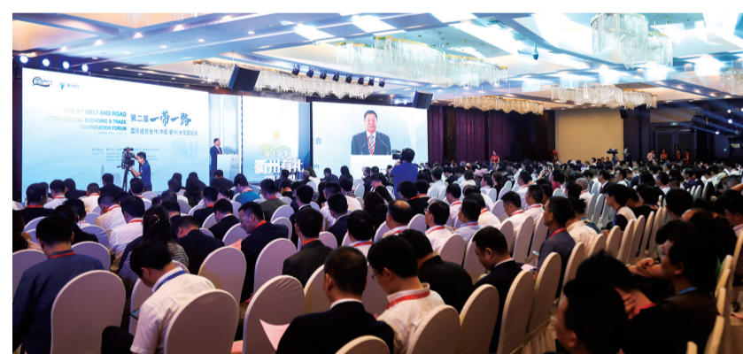
“一带一路”(中国·衢州)国际经贸合作系列活动

械、智能制造等各类产业对接洽谈会,赴上海、深圳、厦门等地举办投资环境推介会。成功举办省第十八届国际投资促进机构联席会议暨新材料产业链招商引资活动,高规格承办全市开放型经济发展暨中国(浙江)自由贸易试验区衢州联动创新区建设推进会。积极打造“南孔圣地·衢州有礼”城市品牌标识,全力打造“好吃衢州”产业链,重点推进将域外衢州餐馆打造成城市品牌宣传窗口工作。