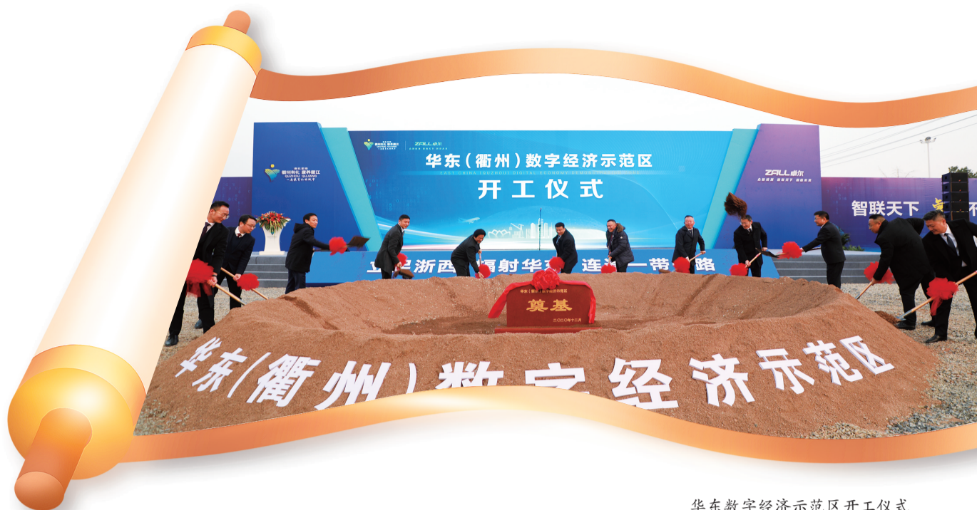
华东数字经济示范区开工仪式

对外贸易:全市进出口总额从2012年的191亿元增长至2021年的493亿元;其中出口从117亿元增长至315亿元,进口从73亿元增长至176亿元,2021年进出口、出口、进口增幅分别位居全省第二、第五、第二。