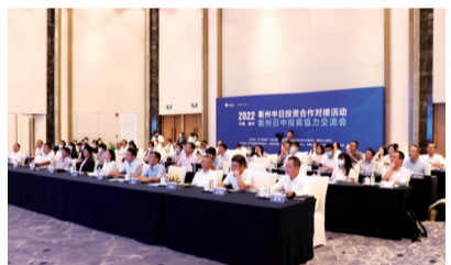
中日投资合作对接会

一方面,倾力服务民生消费,保障消费安全。致力加强大型商超、成品油、二手车市场、预拌砂浆等商务领域行业管理,通过社会化服务,构建商贸流通领域“安全生产双重预防体系”;成立商贸专业安委会,加强商务领域安全生产监管,开展安全生产标准化达标工作;全面落实商务安全监管“一岗双责”责任制,建立“内部落实监管+外部购买服务”工作机制;承办12345热线工单,