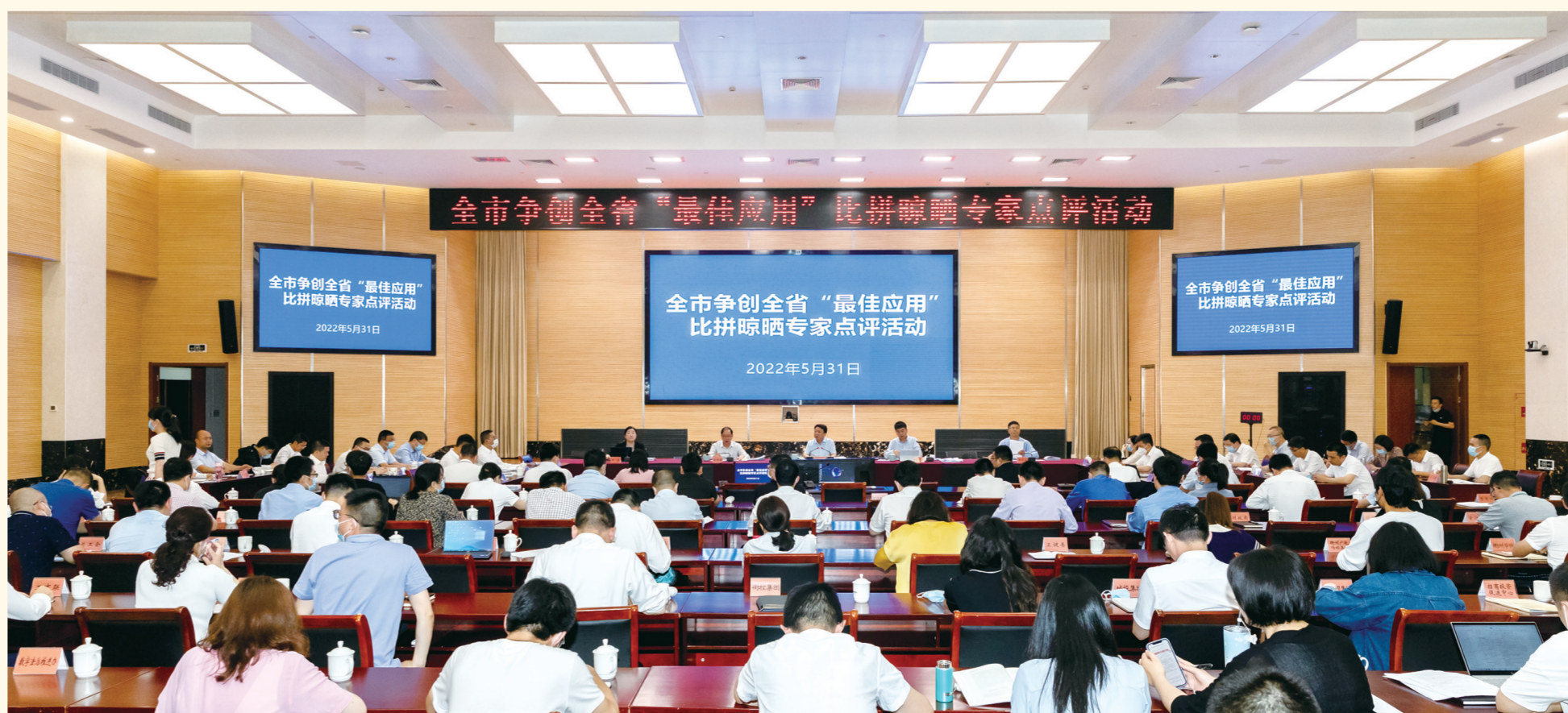
全市争创全省“最佳应用”比拼晾晒专家点评活动现场

代升级奠定了基础。我将以自身技术优势和更深度的业务理解,为政府推动数字化改革贡献一份力量。