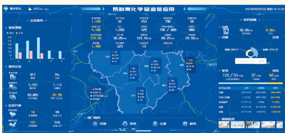
易制毒化学品监管

该应用围绕易制毒化学品出库、经营、运输、使用、销毁等全生命周期管理的5个关键环节,开发建设信息一库归集,流向一屏展示,风险一码掌控、服务一站到底等功能,推动企业、驾驶员和监管部门等多方协同,确保易制毒化学品流通安全。应用于2021年7月22日上线“浙里办”,截至今年5月底,已注册企业1108家