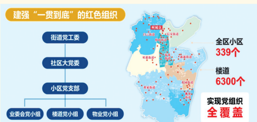
柯城区居民小区楼道党组织全覆盖

民工程”的升级版。上线以来,通过该应用,339个小区、6300个楼道实现党组织全覆盖,4.8万名党员通过邻礼通在社区“亮身份”参与社区治理,并编组参加社区治理工作,处置群众上报事件8466条,协助完成物业费缴费1024万元,向1.01万名未就业人员提供个性化就业服务。