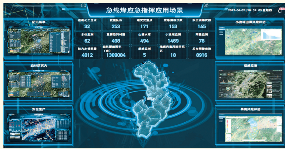
“急线烽”应急指挥应用

损失“三降低”,应急处置效率提升60%,火情同比下降41%,应急处置队伍集结时间降低67%。自2021年6月上线运行以来,应用共准确发布山洪预警287次,烟感报警42次,其他各类报警40次,提前转移群众2514人,实现群众“零伤亡”。