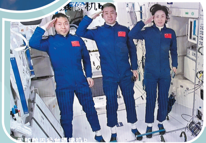
▲6月5日在北京航天飞行控制中心拍摄的进驻天和核心舱的航天员陈冬(中)、刘洋(右)、蔡旭哲向全国人民敬礼的画面。