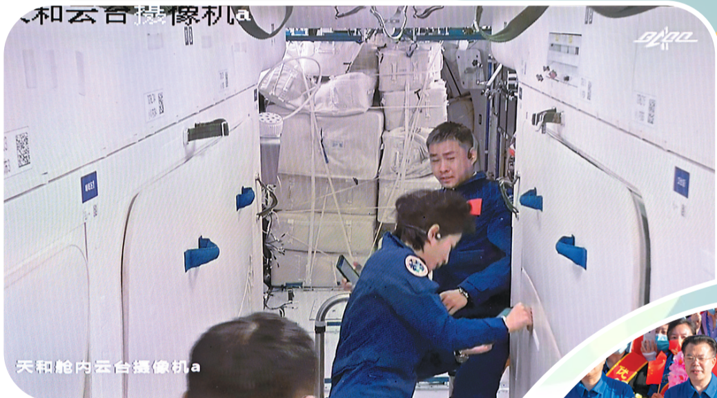
6月5日在北京航天飞行控制中心拍摄的航天员进驻天和核心舱的画面。

神舟十四号飞行任务是我国空间站建造期的关键一战,困难更多、挑战更大。担任此次任务指令长的陈冬在出征前说:“我们乘组一定会以满格的信心、满血的状态、满分的表现,坚决完成任务。”