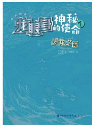
《“龙眼号”的神秘使命1:墨龙之谜》

5月28日,《“蓝碳基因”原创科幻小说系列——“龙眼号”的神秘使命1:墨龙之谜》的出版方鹭江出版社携手厦门市新华书店举办新书发布会,吸引名家汇聚,共述“蓝碳”故事。