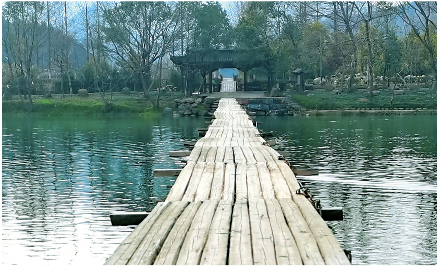
小桥流水 于开化县音坑乡下游村