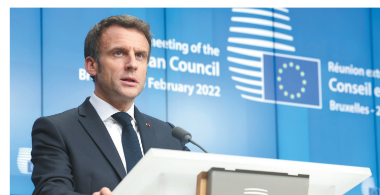
2月25日,在比利时布鲁塞尔,法国总统马克龙在欧盟特别峰会后的新闻发布会上发言。

同时,欧盟将对乌克兰增加财政援助,并为可能受到危机影响的欧盟国家,尤其是与乌克兰接壤的欧盟国家提供支援,如做好难民收容准备等。