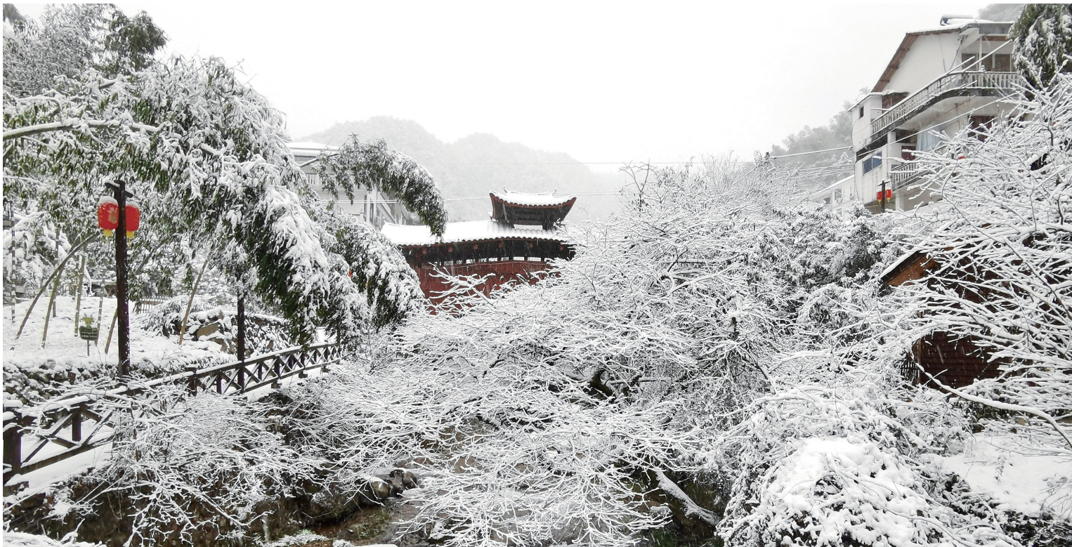
七里雪色于柯城区七里乡桃源村