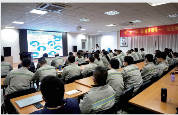
为企业员工介绍防疫知识