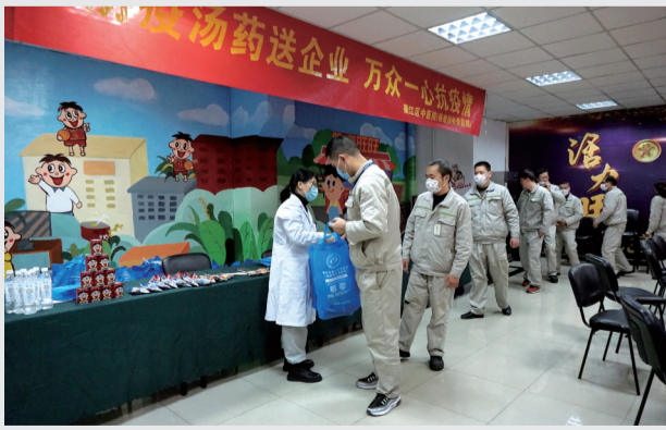
为企业员工赠送防疫礼包

两百多人，大概两个小时就能做好。”此次活动相关负责人相告，为了给企业提供更多、更好的服务，衢江区中医院积极与智造新城东港片区企业服务中心对接，为有需要的企业提供个性化的上门服务，截至目前已有13家企业报名。在春节前，衢江区中医院