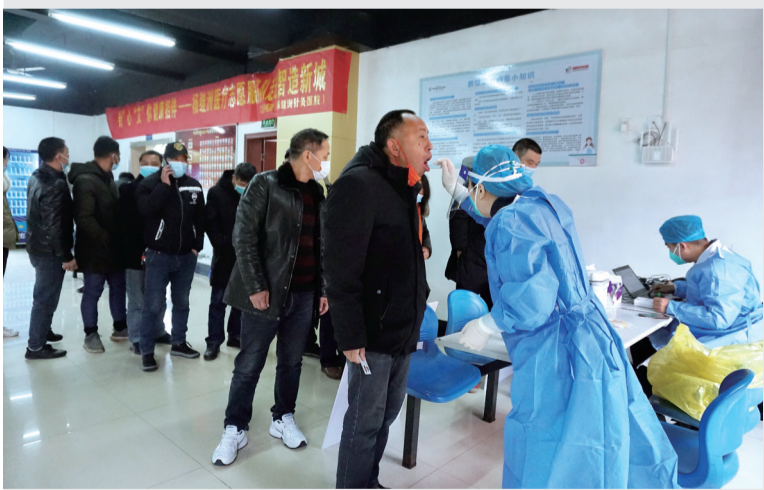
为企业员工做核酸检测

“做了核酸检测，我们明天就可以回家过年啦！”新春佳节将近，1月18日上午，衢江区中医院杨继洲医疗志愿服务队走进智造新城相关企业，为企业员工提供上门核酸检测服务，并开设防疫知识讲座，赠送防疫礼包，助力企业员工顺利、安全返乡。