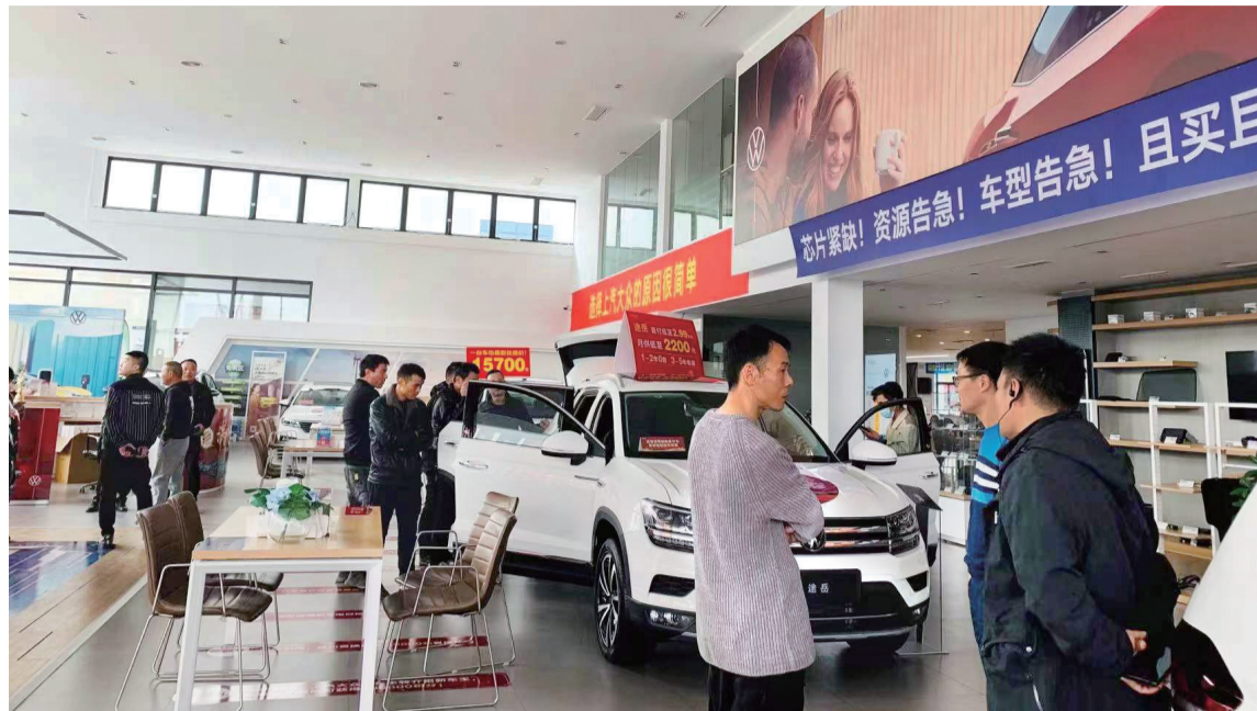
市民在上汽大众4S店选购爱车